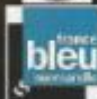
Illustration par Anne-Sophie - Art 214 - www.art214.com